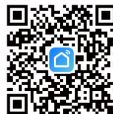
Smart Life App